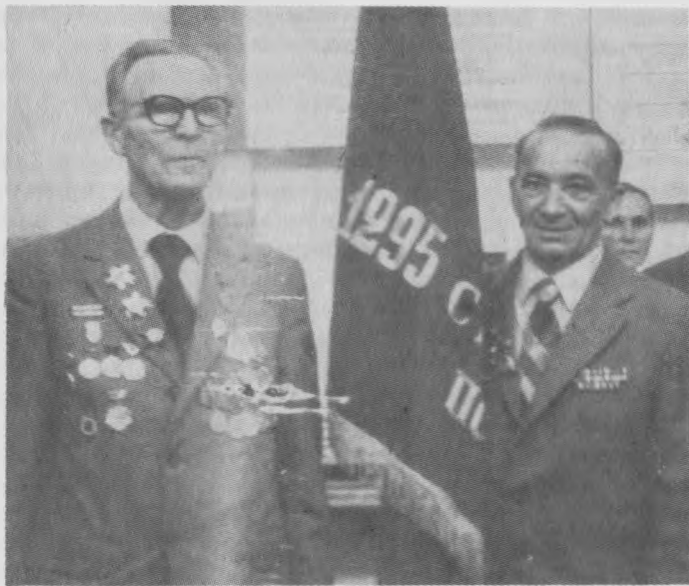
40-лет Победы(1985 г.) Центральный музей Советской Армии. У боевого знамени.