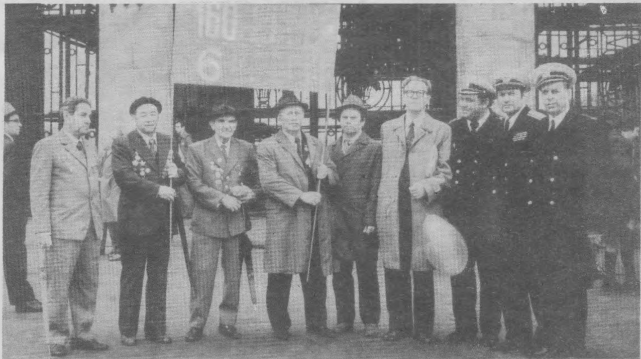
9 мая 1978 года. День Победы. Парк культуры им.Горького г.Москва