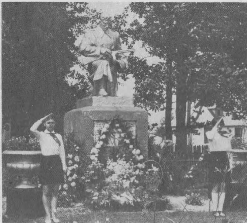
Кладбище погибших воинов в 1941-1944 годах, г. Ратно, Белоруссия.

Торжественным днем для дивизии стало 24 декабря. В этот день состоялся парад всего личного состава по случаю вручения дивизии Боевого Красного Знамени и ордена Красного Знамени, которым дивизия была награждена за прорыв обороны врага в районе города Ковель.