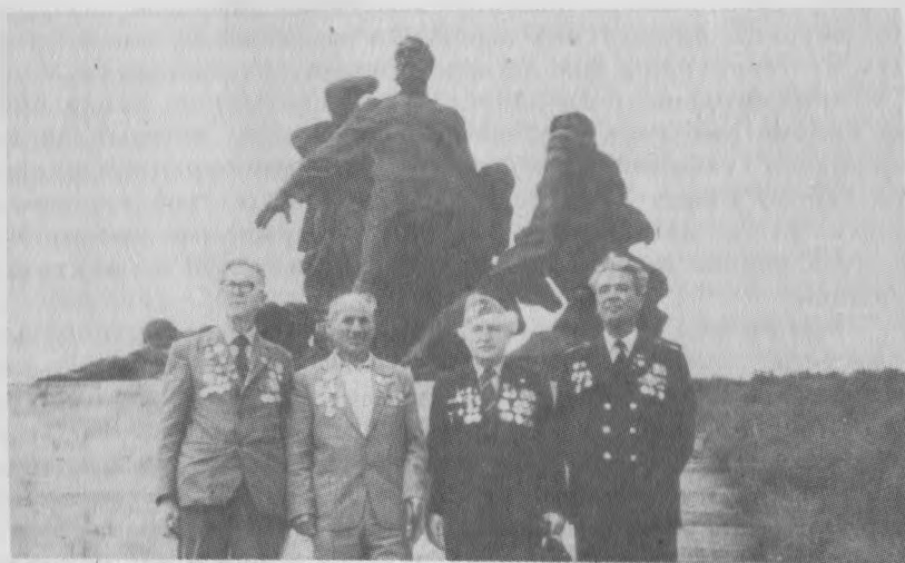
У мемориального комплекса в память погибших 2875 жителей с.Кортелисы (село сожжено 23.09.42 г.) Вольнской области, Украина.

Разгром противника в Люблин-Брестской операции показал возросшую мощь наших войск и вселял уверенность в успехах предстоящих наступательных боев.