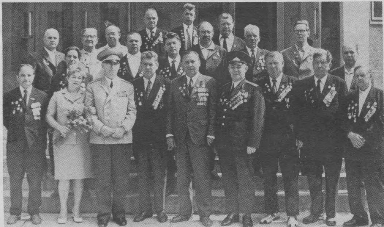
30 лет освобождения г. Бреста. Ветераны 160-й стрелковой Брестской Краснознаменной дивизии